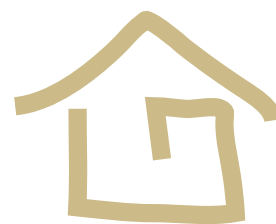
ГРАФИК ПОДАЧИ И ВЫХОДА РЕКЛАМНЫХ МАТЕРИАЛОВ